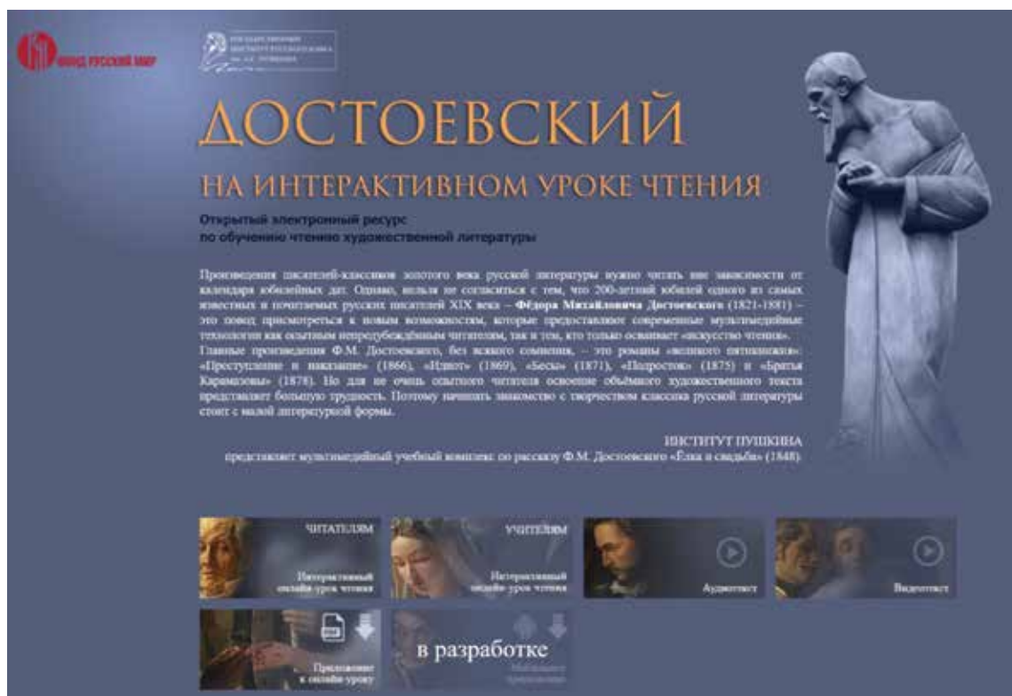
Рисунок 1 Фрагмент Главной страницы проекта.

На сайте интерактивного авторского курса по обучению чтению художественной литературы представлены интерактивные онлайн-уроки учения по художественным текстам русских писателей XVIII–XX веков (Ломоносова, Державина, Пушкина, Тютчева, Бунина и др.), а теперь и Фёдора Михайловича Достоевского, ранний рассказ которого «Ёлка и свадьба» (1848) лёг в основу мультимедийного комплекса «Достоевский на интерактивном уроке чтения», созданного при финансовой поддержке фонда «Русский мир»